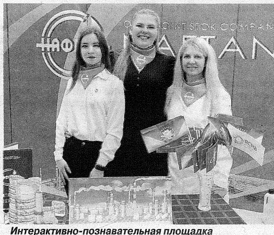
Интерактивно-познавательная площадка ОАО «Нафтан»