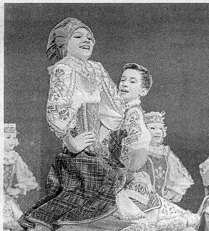
Творчество – гостям