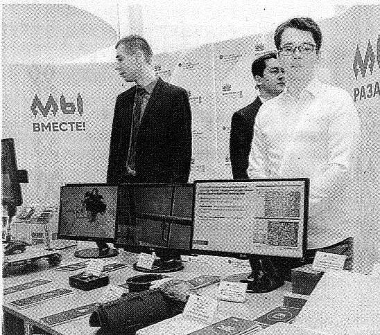
ПГУ на выставке достижений в ДКН