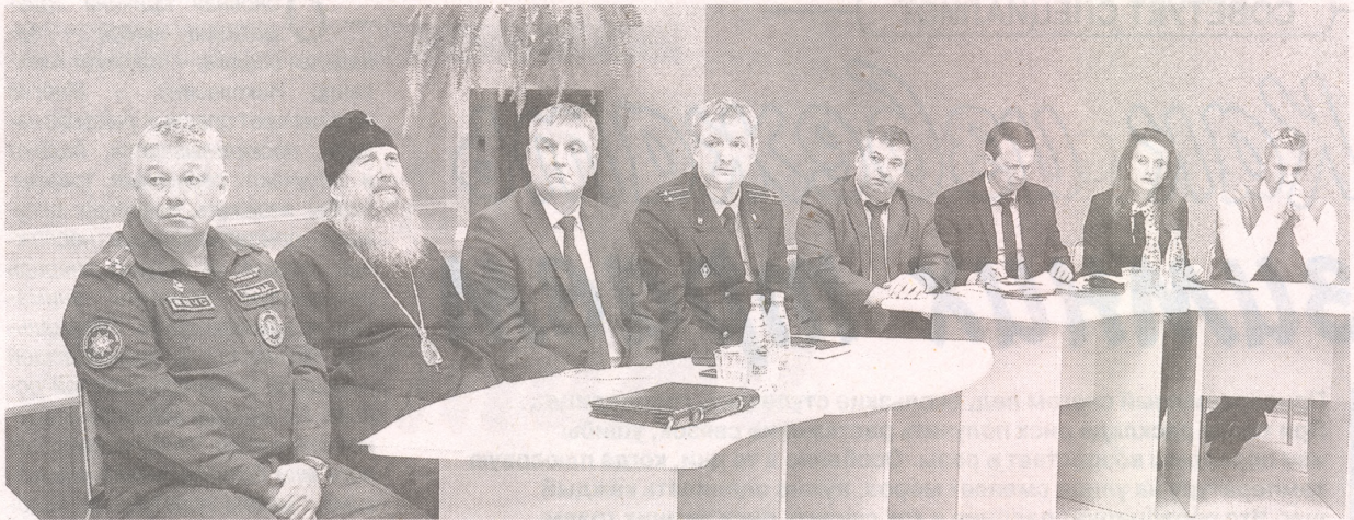
Организаторы и спикеры форума

По мнению специалиста, ответственное отцовство положительно влияет на супружеские отношения и атмосферу в семье, делает ее более счастливой и здоровой. Данные проведенного в Новополоцке исследования подтверждают, что отцовство благоприятно воздействует на мужчин.