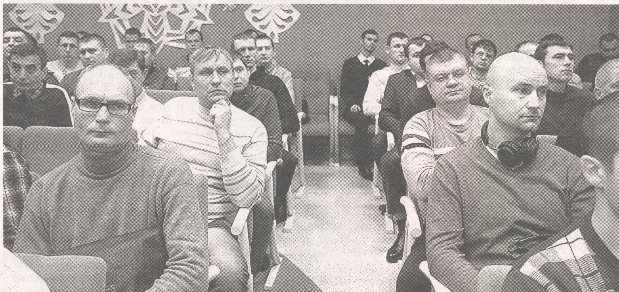
Участники первого городского собрания отцов

какое участие папы принимают в воспитании детей, напомнил, что именно от отца ребенок перенимает ориентиры, основы жизни, семейные ценности. Обозначив цели и задачи встречи,