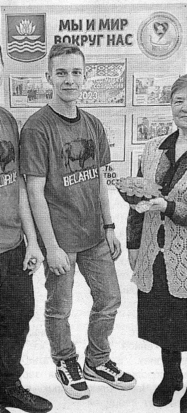
Ребята из политеха остались в восторге от диалоговой площадки

Считаю, очень важно, чтобы граждане в возрасте и молодежь нашли общий язык. Ведь все люди мыслят по-разному, а общение помогает расширить кругозор и обогатить внутренний мир. Поэтому нужно беречь эту возможность и внимательно слушать друг друга. Надеюсь проект «Живая связь поколений» будет иметь долгосрочную перспективу. Уверена, что мы сможем реализовать еще много интересных и креативных идей».