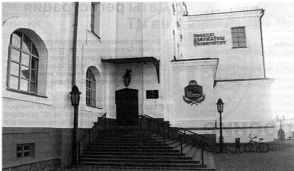
В 2018-м в Полоцком коллегииуме состоялось открытие «Ректорского входа»