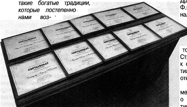
Сертификаты для тех, кто участвовал в создании галереи