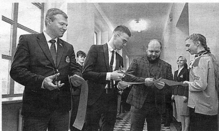
Торжественный момент перерезания красной ленты

В Полоцком госуниверситете теперь смогут разрабатывать интеллектуальные проекты в сфере обеспечения техногенной и криминогенной безопасности. На днях ведущий вуз нашего региона подписал соглашение с крупной IT-компанией - Innowise Group, совместно с которой открыл новую научно-инновационную лабораторию машинного обучения и больших данных.