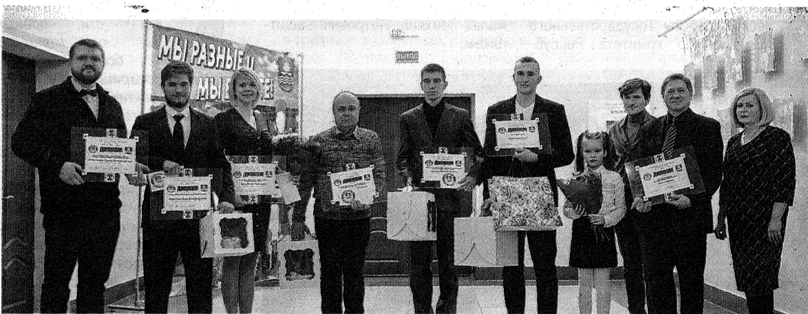
Лауреаты городского форума