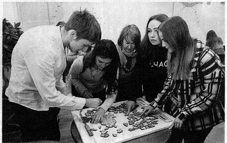
Российская молодежь складывает спилс-карту Беларуси