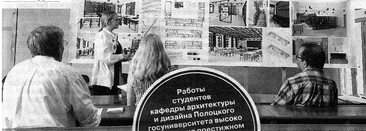
Защита проекта «Интерьеры средней школы №19 в г. Бобруйске»

Работы студентов кафедры архитектуры и дизайна Полоцкого госуниверситета высоко отметили на престижном Всероссийском фестивале «Драйверы развития современного города» в Москве.