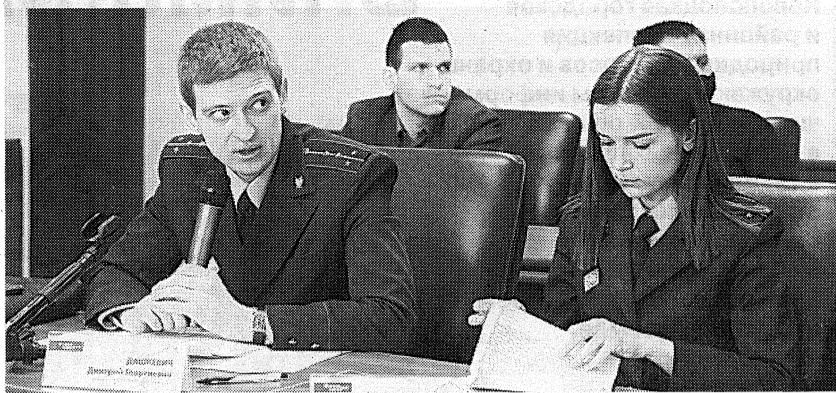
Участники круглого стола в ПГУ – представители прокуратуры