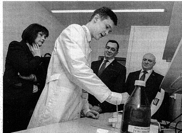
Модернизированная лаборатория стала одним из элементов Новополоцкого инновационного нефтехимического кластера

ным направлениям, опережающим запросы промышленности, а также даст возможность сконцентрировать ресурсы на областях основных научно-инновационных компетенций университета с целью достижения прорывных результатов и занятия лидирующих позиций в конкретных научно-технологических нишах.