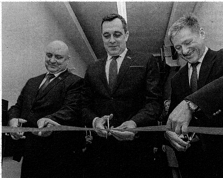
Церемония перерезания красной ленты

По словам научных руководителей ПГУ, модернизация лаборатории позволит расширить области ее аккредитации для осуществления лицензионных видов деятельности в интересах предприятий региона, поможет осуществлять научно-исследовательские работы по приоритет-