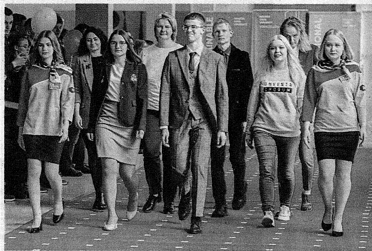
Торжественное шествие по красной ковровой дорожке