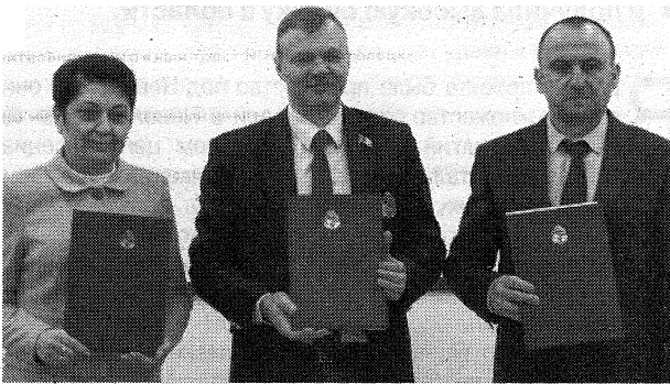
Торжественная церемония подписания договора

На базе средней школы №1 г. Новополоцка и Полоцкого госуниверситета начал работу профориентационный образовательный проект в сфере инженерно-строительной деятельности. Партнером в его реализации выступает ОАО «Строительно-монтажный трест №16, г. Новополоцк».