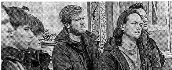
Студенты в Богоявленском кафедральном соборе