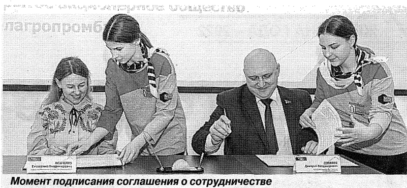
Момент подписания соглашения о сотрудничестве

В Полоцком госуниверситете имени Евфросинии Полоцкой открылся центр стартапов и предпринимательских инициатив.