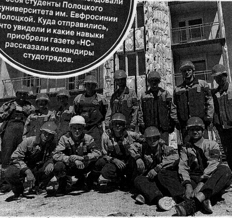
«Эврика» на объектах Дальнего Востока России

На дворе середина августа, а это значит, что близится завершение Третьего трудового семестра-2023. На его крупных республиканских и международных проектах хорошо зарекомендовали себя студенты Полоцкого госуниверситета им. Евфросинии Полоцкой. Куда отправились, что увидели и какие навыки приобрели в газете «НС» рассказали командиры студотрядов.