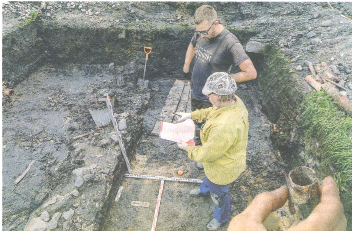
Археолог и волонтер на месте обнаружения плавильной печи

риоду кварталы проживания ремесленников одного направле-