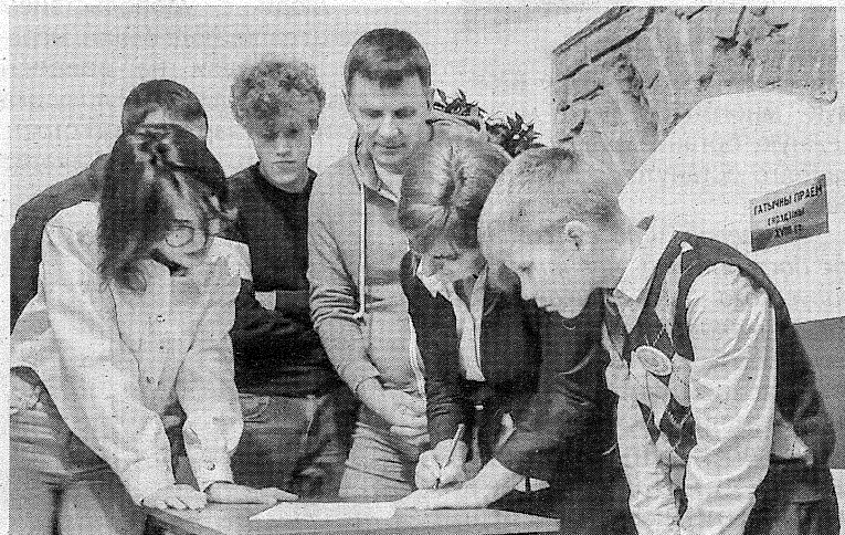
Проведение интерактивной игры в IT-HALL.