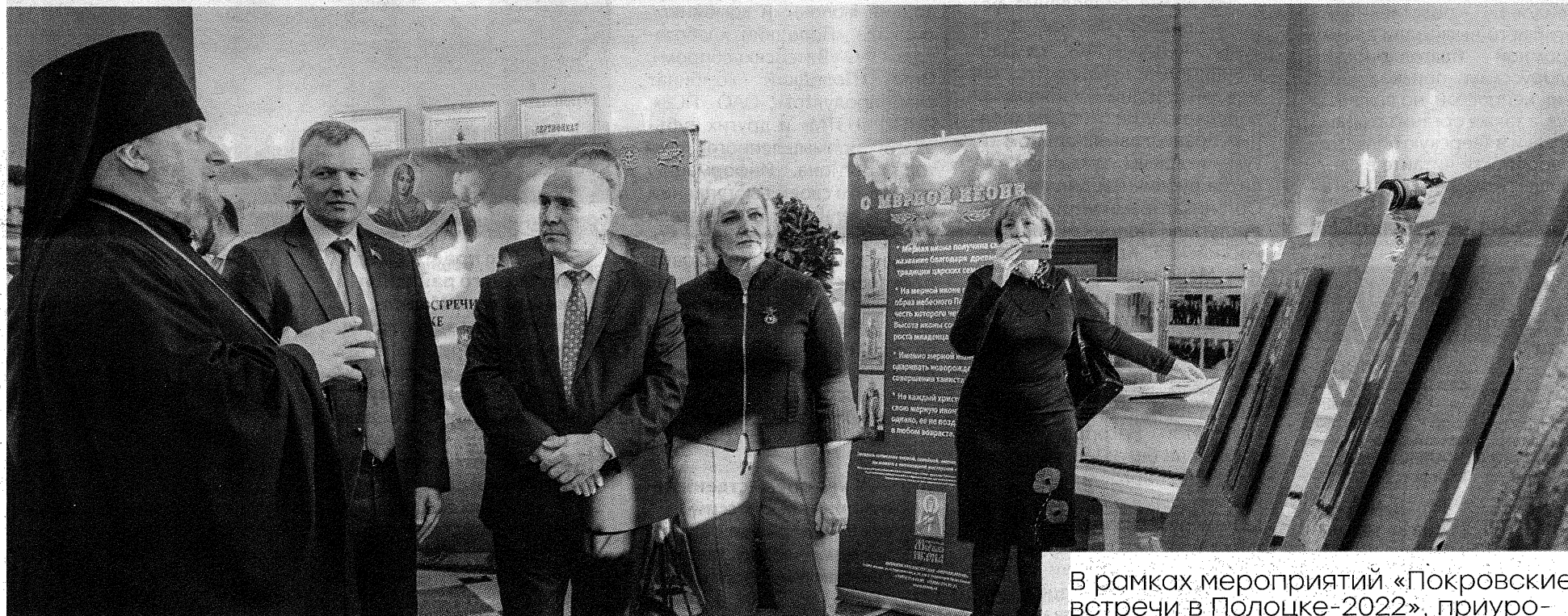
Участники открытия выставки мерной иконы.

В рамках мероприятий «Покровские встречи в Полоцке-2022», приуроченных к празднованию 1030-летия образования Полоцкой епархии и Белорусской православной церкви, в нашем городе прошел Международный православный экономический форум.