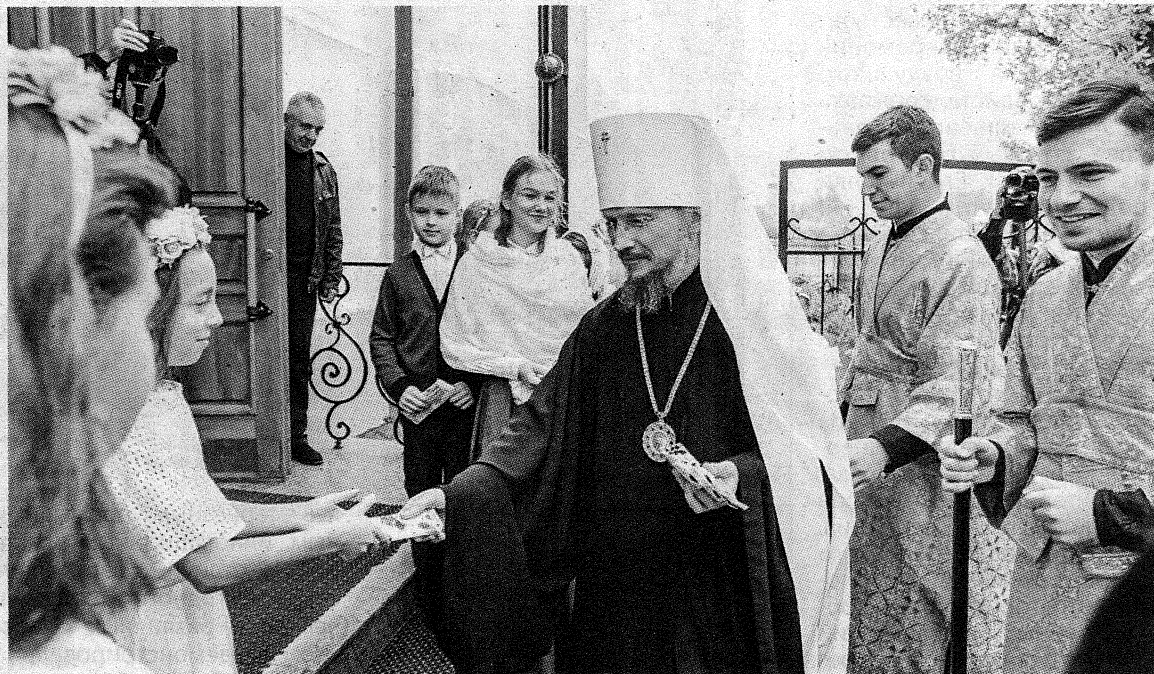
Митрополит Минский и Заславский Вениамин, Патриарший Экзарх всея Беларуси, у Богоявленского собора.