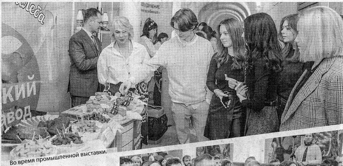
Во время промышленной выставки.