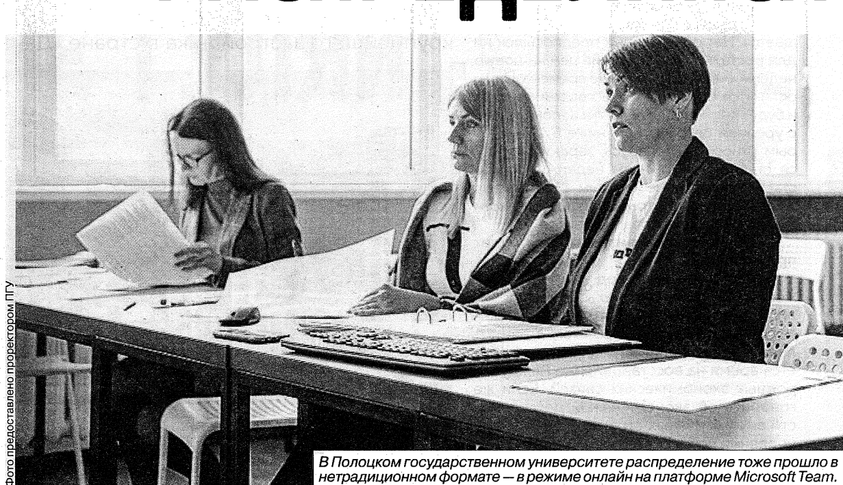
В Полоцком государственном университете распределение тоже прошло в нетрадиционном формате — в режиме онлайн на платформе Microsoft Team.