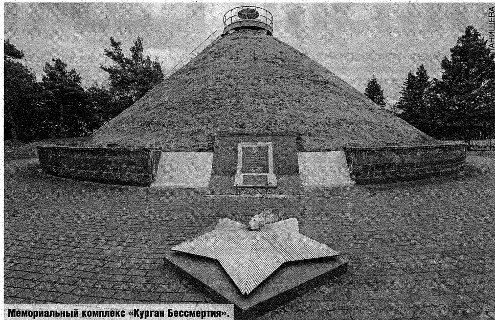
Мемориальный комплекс «Курган Бессмертия».