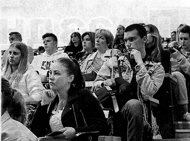
На открытом заседании приемной комиссии по зачислению в университет