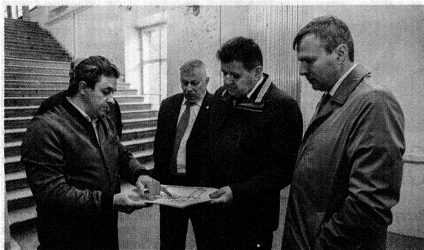
Во время обсуждения проекта.