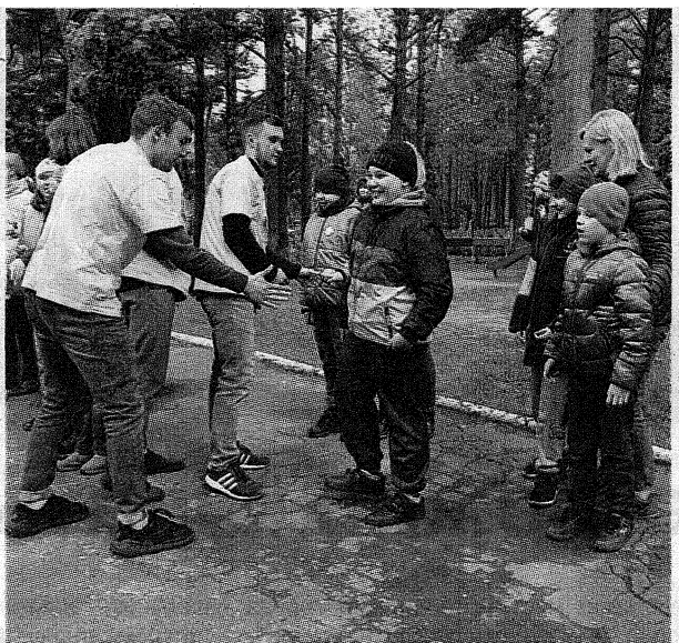
Воспитанники центра были очень рады гостям

Море положительных эмоций, улыбок и радости подарили студенты 4-го курса кафедры физической культуры и спорта Полоцкого государственного университета воспитанникам Центра коррекционно-развивающего обучения и реабилитации г. Новополоцка.