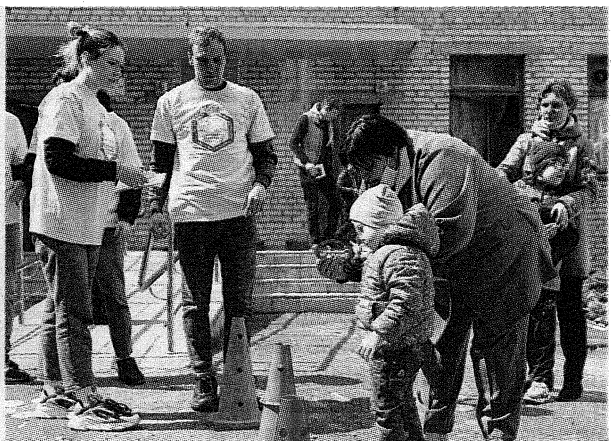
Студенты ПГУ постарались увлечь всех

Программа события была насыщенной и интересной. Театрализованное представление, которое талантливо разыграли студенты, захватило и детей, и воспитателей. Неожиданным сюр-