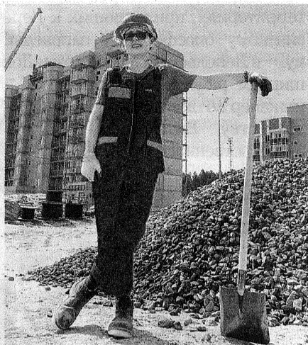
Условия труда у нас хорошие, даже перевыполняем план

После работы у нас прошли соревнования по стритболу. Все три сыгранных матча мы победили. В среду поучаствовали в конкурсе на поднятие 16-кило-