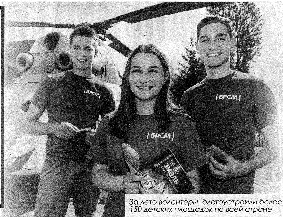
За лето волонтеры благоустроили более 150 детских площадок по всей стране

Подходит к концу трилогия Года малой родины. Для многих это время стало поводом вернуться к дорогим сердцу местам и сделать что-то полезное для своего города, улицы или подъезда. Посадить дерево в парке или сквере, куда ходил после уроков с одноклассниками, собрать мусор на берегу озера, где встречал самые красивые рассветы, прополоть клумбу у памятника солдатам, погибшим во время Великой Отечественной войны, или предложить идею, которая поможет привлечь инвестиции в родной край. За три года были реализованы десятки полезных инициатив. Мы решили вспомнить самые яркие проекты с участием молодежи.