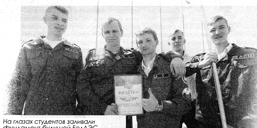
На глазах студентов заливали фундамент будущей БелАЭС, возводили стены энергоблоков

Кроме масштабных республиканских проектов за трилогию было реализовано и