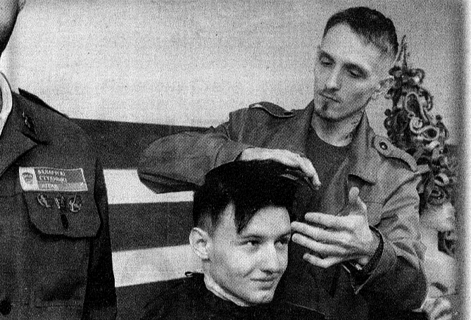
Парикмахерская на выезде