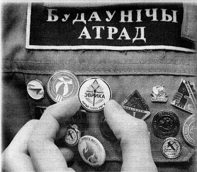
Каждый значок на бойцовке важен