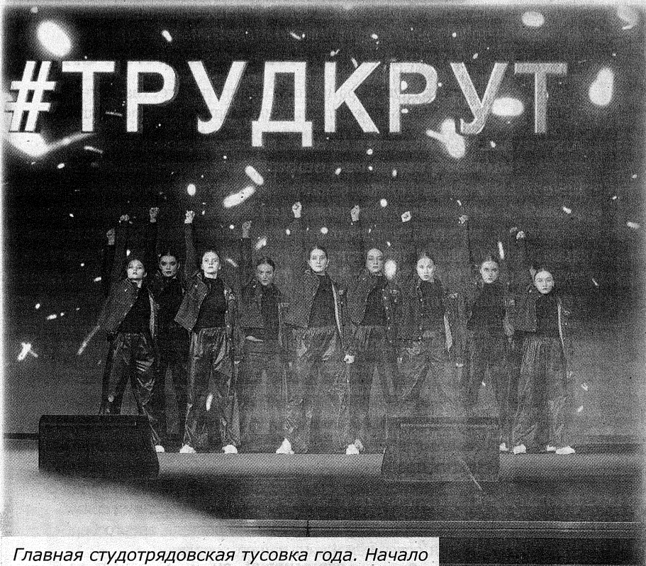
Главная студотрядовская тусовка года. Начало

Такого количества одетых в бойцовки гостей, как в прошлый четверг, «Чижовка-Арена» в Минске не видела никогда. Сюда на подведение итогов третьего трудового семестра, посвященного Году исторической памяти, съехались шесть тысяч командиров, комиссаров и участников студенческих отрядов со всех регионов. Что может объединять этих непохожих друг на друга ребят? Желание работать и быть полезными – в этом корреспонденты «Знаменки» убедились, заглянув на главную студотрядовскую тусовку 2022-го.