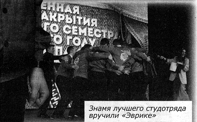
Знамя лучшего студотряда вручили «Эврике»