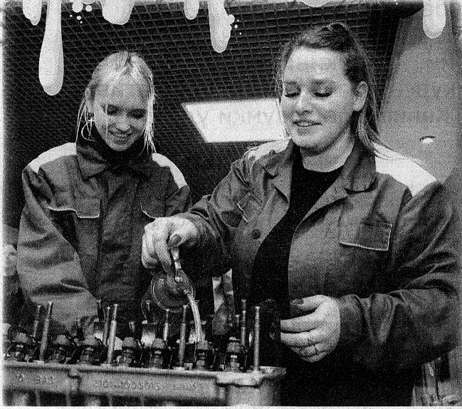
Собрать мотор за десять минут? Для девчонок из БГСХА это не проблема