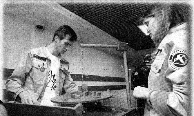
Главное – держать баланс