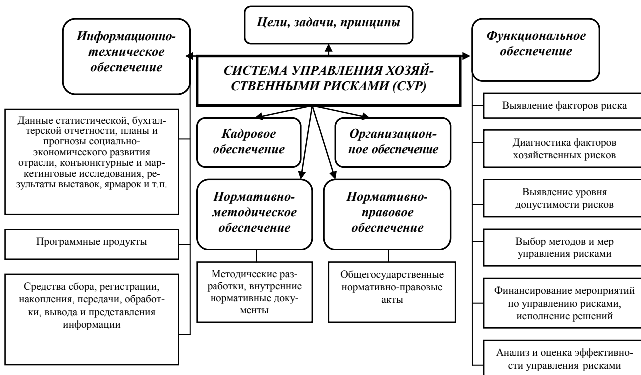
Рисунок 2 – Система управления хозяйственными рисками

– предложен детализированный процесс управления рисками, что позволило выделить три стадии, в том числе диагностику риск-факторов (рисунок 3);